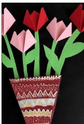
Abbildung | Arbeit aus dem Bildnerischen Gestalten 3