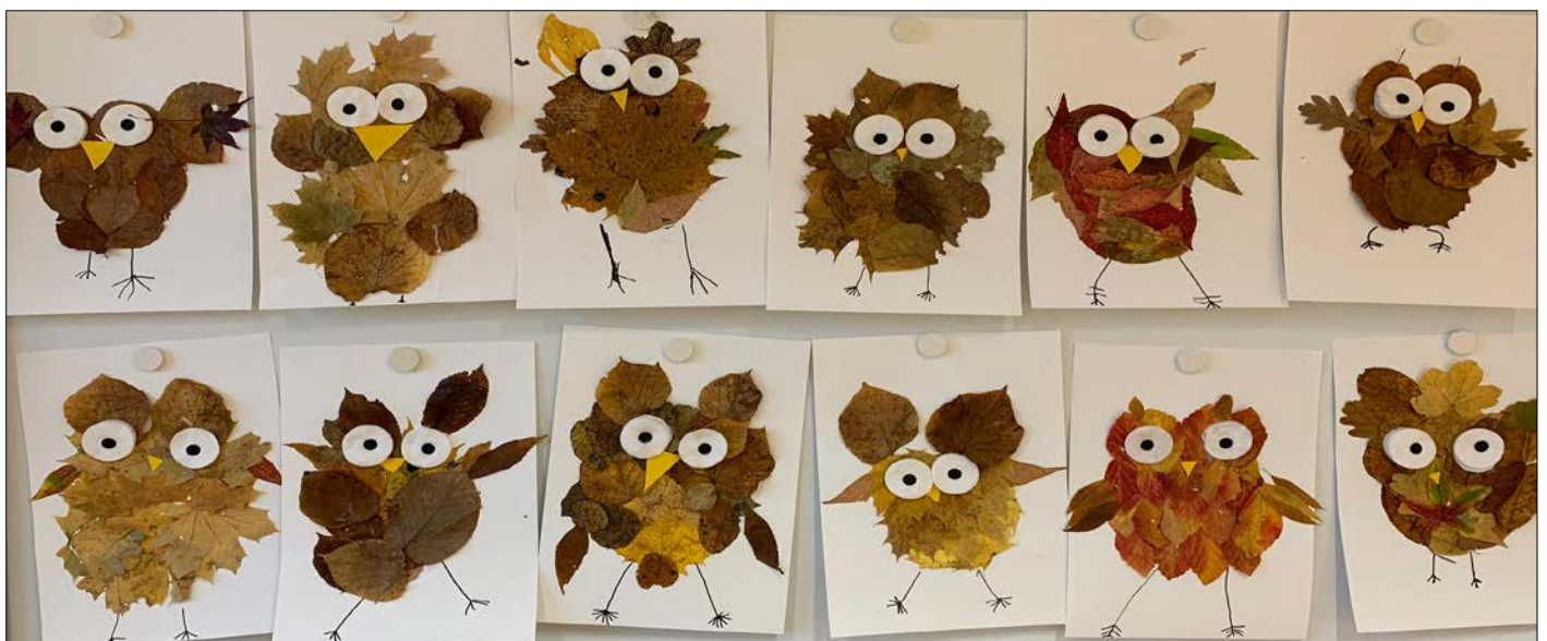
Abbildung | Arbeiten aus dem Bildnerischen Gestalten 1b

* Am Mittwochnachmittag, 13. April 2022, 25. Mai 2022 und 15. Juni 2022 findet Unterricht statt.