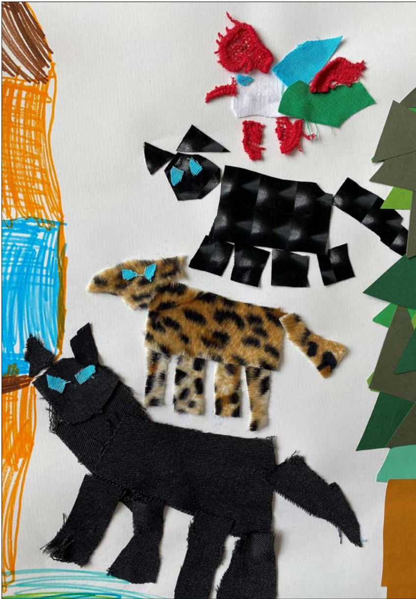
Abbildung | Arbeit aus dem Bildnerischen Gestalten 2b