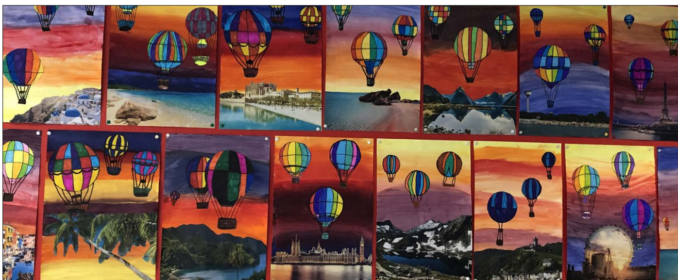
Abbildung | Arbeiten aus den Projekttagen Mittelstufe I

* Am Mittwochnachmittag, 05. April 2023, 17. Mai 2023 und 07. Juni 2023 findet Unterricht statt.