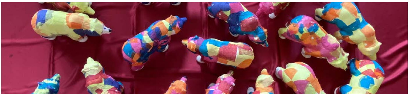
Abbildung | Arbeit aus den Projekttagen Unterstufe

Für alle Kinder aus Bauen (alle Stufen) und Biel (bis Ende 2. Klasse) werden die Transportkosten vollumfänglich von der Schule übernommen. Nutzen Kinder aus Biel (ab 3. Klasse), Bolzbach und Bodmi den Schulbus, werden die Transportkosten den Eltern in Rechnung gestellt. Den Fahrplan des Schulbusses entnehmen Sie auf unserer Homepage.