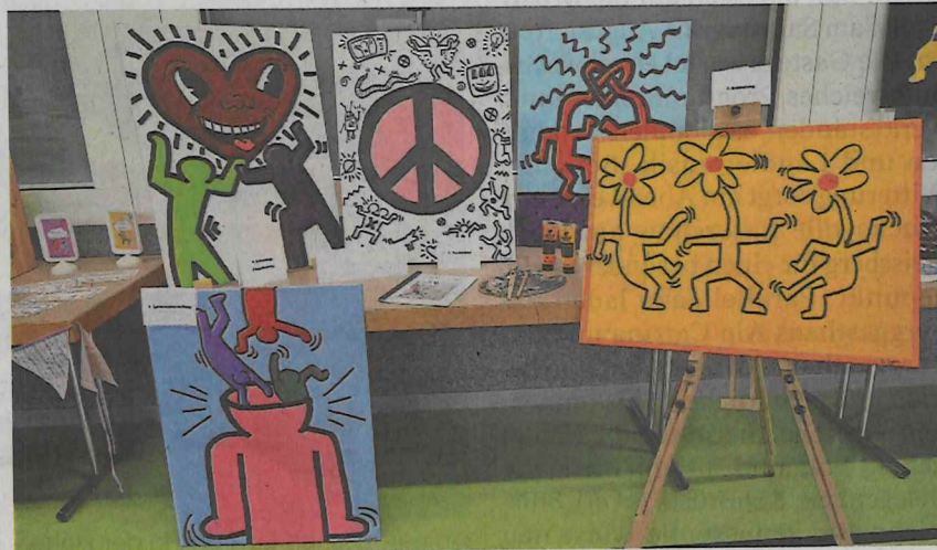
Rund 50 Projekte wurden ausgestellt.

sem Nutzen sein werden», war in der schriftlichen Dokumentation einer Schülerin nachzulesen. Das Fazit fiel grösstenteils sehr positiv aus. «Ich habe die Mehrheit meiner selbstgesteckten Ziele erreicht und bin stolz auf meine Arbeit!», war ebenfalls mehrfach in den Dokumentationen zu lesen. (e)